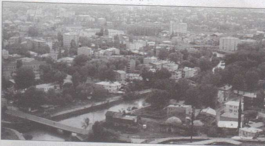
● Kars ilimizden bir görünüm