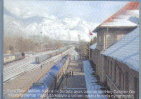
Kars'ın Altın Kars'a ilk burada ayak basmış ve Hacı Çelebi Özalp Mustafa Kemal Paşa'nın şarkısıyla o bilinen oyunu burada oynamıştır.