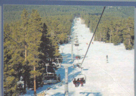
Uşak'tan Çıldır'a Kayak Merkezi