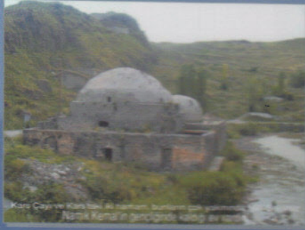
Kars Çayı ve Kars'taki ilk hamamın bulunduğu yerdir. Namık Kemal'in gençliğinde kaldığı yerdir.