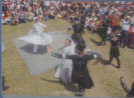
Çıldır Dağı Festivali