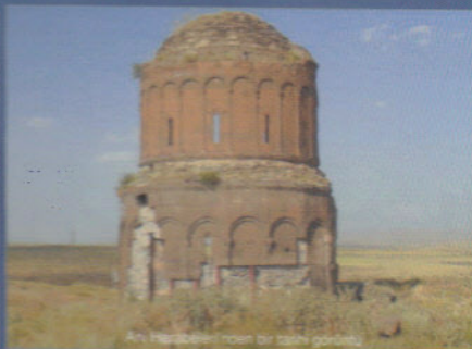
Anı Hilafetleri'nin bir tanesi görünüyor.