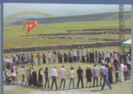
Kars'ta düzenlenen Festival'den bir görüntü.